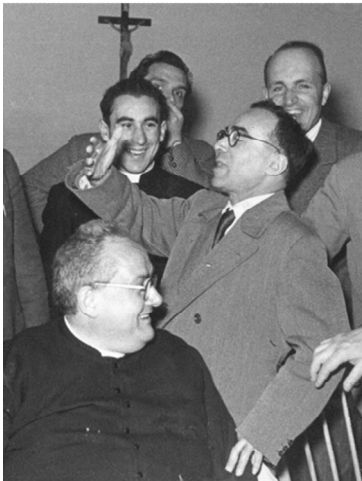
Monsignor Carlo Poggi insieme al sindaco Giorgio La Pira

voleva entrarci dentro e capirla. Ebbe la grande genialità di capire fino dagli anni '60 l'importanza che avrebbe avuto il computer nel futuro. Assieme a due colleghi lavorò sempre in questa direzione, diedero vita a una azienda che costruiva macchine per componenti dei computer in silicio, ebbero alterne vicende come accade a tanti imprenditori, ma nel tempo l'evoluzione delle cose gli diede ra-