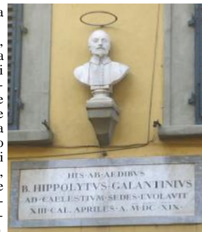
In via della Scala, un busto ricorda il beato Galantini sulla casa dove morì il 13 Aprile del 1619.

Di San Miniato, primo martire fiorentino, si ha notizia dal 786, anno a cui risale un diploma col quale Carlo Magno, in memoria della moglie, donava alcuni possedimenti alla "chiesa di San Miniato, martire di Cristo, posta in Firenze, dove riposa il suo venerabile corpo".