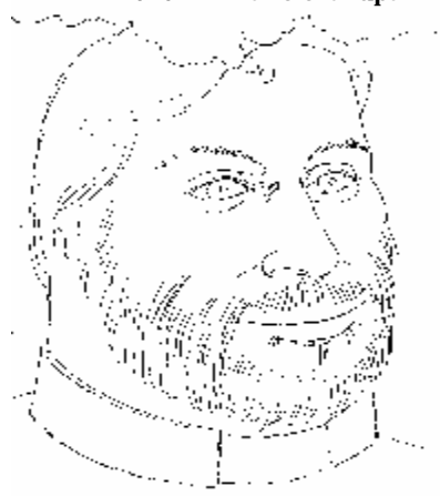
"Gli amori del vice parroco" visti da GIANNETTO.

VIVA LA SS. TRINITA' VIVA GESU' VIVA MARIA VIVA LA FIORENTINA VIVA IL Palio e la lupa